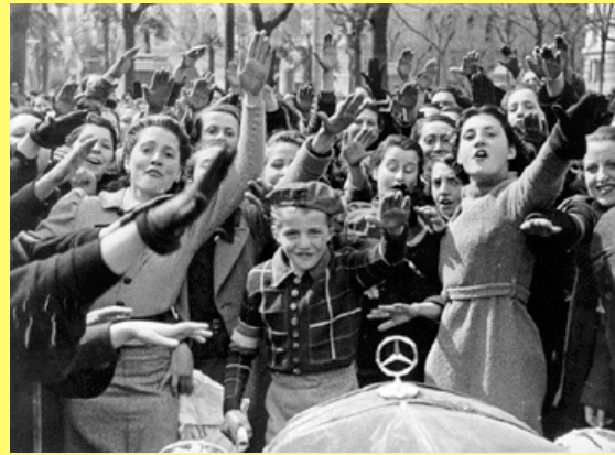
Las Mujeres Españolas dan la bienvenida a las tropas de Franco.

Las mujeres españolas dan la bienvenida a las tropas del general Franco. Mira su modo de vestirse. Los dobladillos son largos, los pechos no se acentúan en modo alguno, y están completamente cubiertas de las manos al cuello. http://www.nobelprize.org/nobel_prizes/peace/articles/co