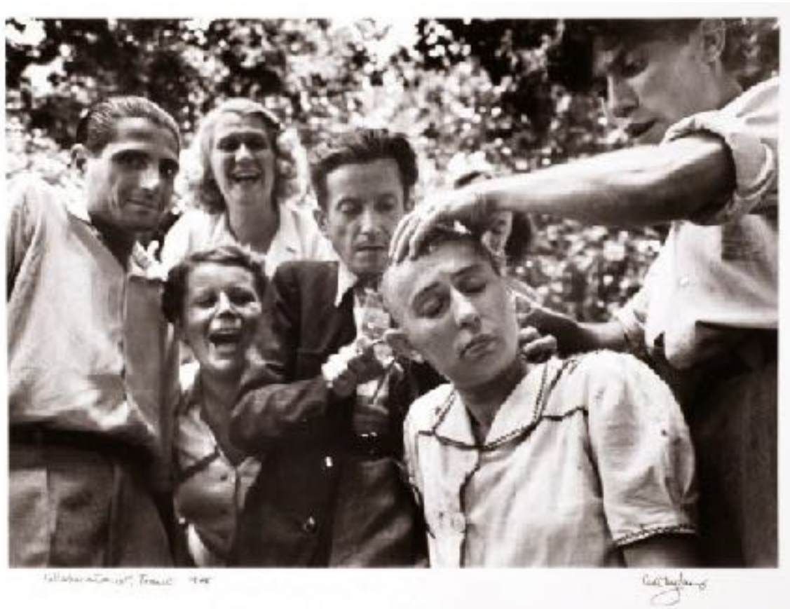
Figure 6. “Une tondue, 1944.”