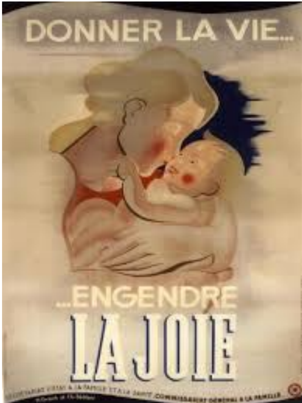
Figure 1. “Donner la vie... engendre la joie.” Dans cette image, la maternité est directement liée au bonheur de la femme.

qui lit “Donner la vie... engendre la joie.” Cette stratégie presque manipulatrice enchaîne le bonheur de la femme avec l’expérience d’avoir une enfant avec un message très clair: le bonheur de la femme réside dans la maternité.