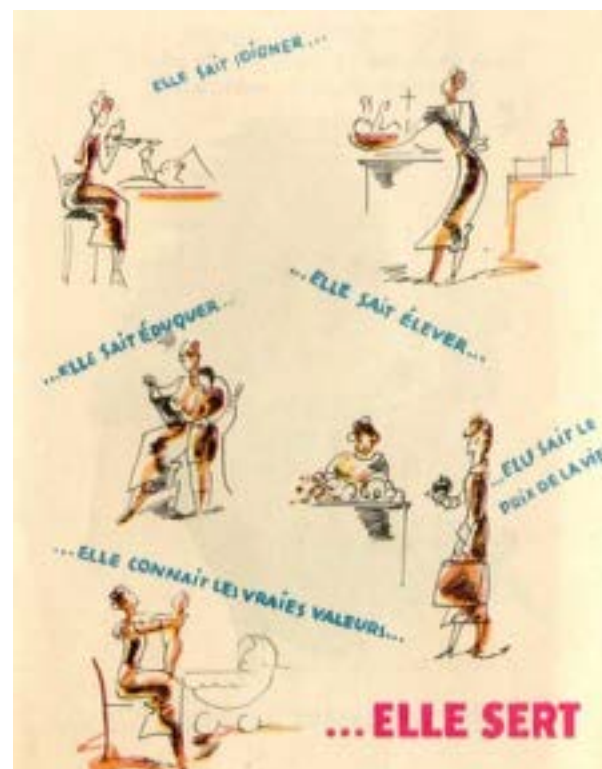
Figure 3. La Mère. “Elle sait soigner... Elle sait éduquer... Elle sait élever... Elle sait le prix de la vie... Elle connaît les vraies valeurs... Elle sert.” Dans cette image de propagande, la femme avec enfants est considérée comme une personne de valeur pour la société et qui sert à la patrie.