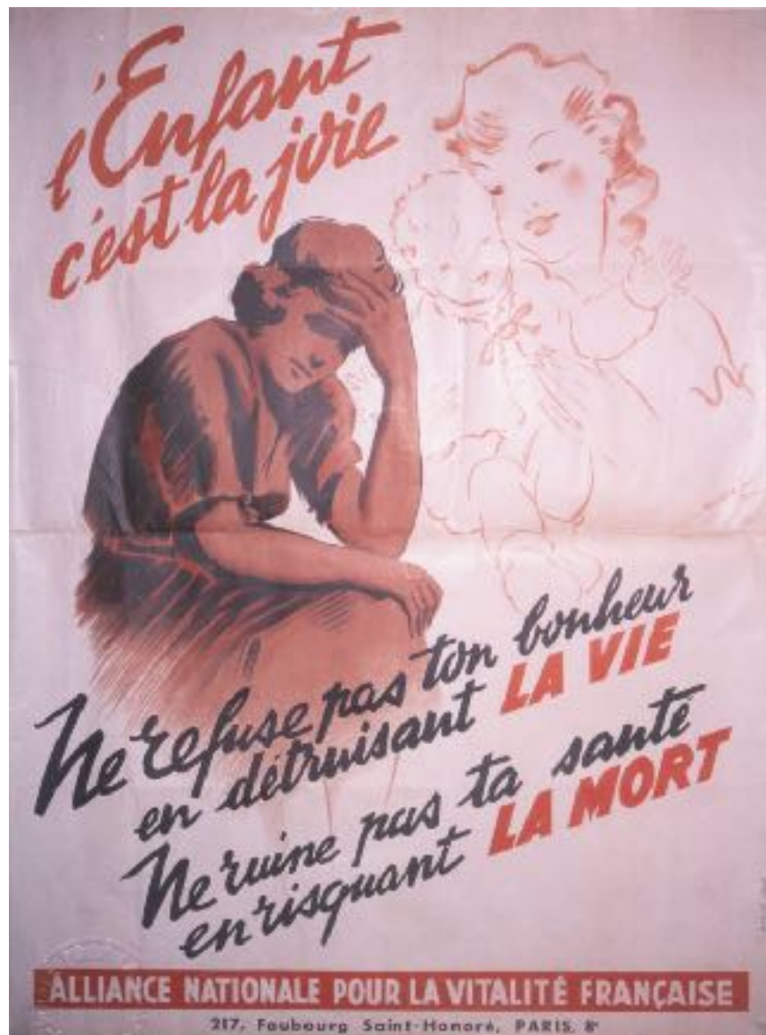
Figure 4. Le danger de l’avortement. “L’enfant c’est la joie. Ne refuse pas ton bonheur en détruisant la vie. Ne ruine pas ta santé en risquant la mort.” Image propagandiste diffusée par l’Alliance Nationale pour la Vitalité Française.

“L’enfant c’est la joie. Ne refuse pas ton bonheur en détruisant la vie. Ne ruine pas ta santé en risquant la mort.” L’image, qu’on a trouvé sur la web était publié par l’Alliance Nationale pour la Vitalité Française, liait le bonheur de la femme avec la maternité au même temps qui soulignait le danger que les femmes prennent quand elles ont des avortements.