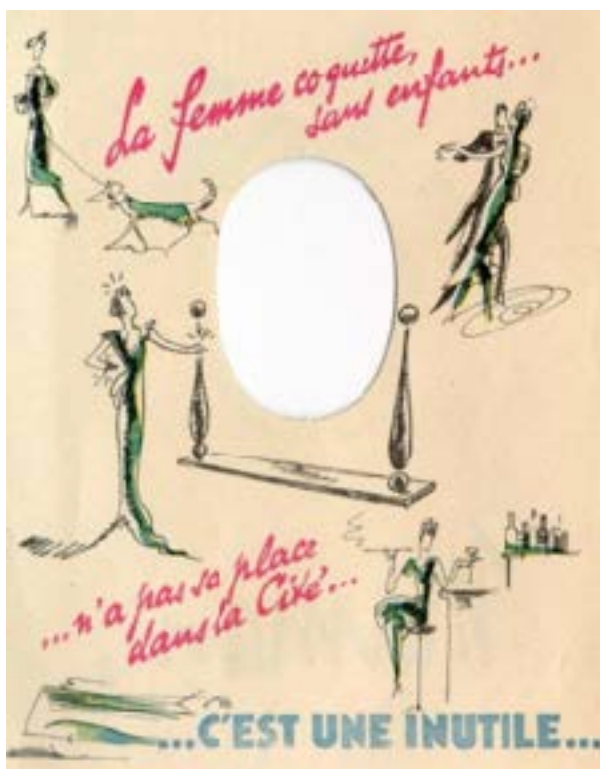
Figure 2. “La femme coquette, sans enfants... n’a pas sa place dans la Cité... C’est une inutile...” Ici, la femmes sans enfants est dépeinte comme une personne que ne contribue rien à la société française.