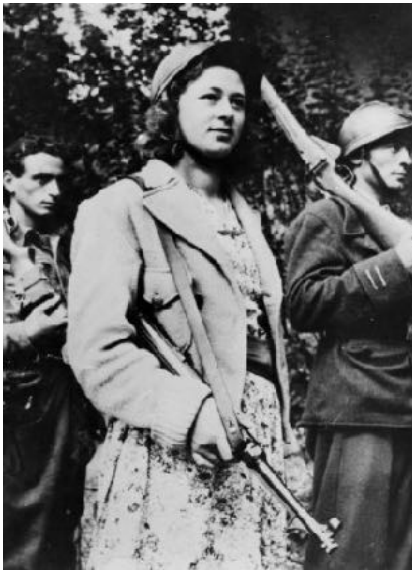
Figure 5. “Résistance corse, 1943.” Photo d’une femme de la résistance qu’on a trouvé sur le site Web du Ministère de la Défense.

hommes les avaient laissé tomber » (Grenoble: le Changement, mai 2016). En plus, pendant les interrogations elle ajoutait que « tout ce que j'ai pu faire, je l'ai fait par amour pour mon pays et avec l'entière approbation de ma conscience » (Grenoble: le Changement, mai 2016). Cette conviction la motivait à rejoindre la résistance après d'être libérée, mais elle devait se réfugier à l'Oisans en 1944 (Grenoble: le Changement, mai 2016).